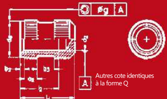
Form S cylindrical with spigot l2 H 1,5 d1